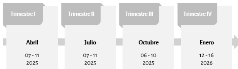
Esquema 2. Monitoreo trimestral a las Ae del PAEG 2025

El monitoreo del PAEG se realizará conforme al calendario establecido (ver Esquema 2). Para dar atención a ello, las UE de los SNI y las UA del INEGI-UCC reportarán el avance realizado en la ejecución de sus Ae en el sitio de monitoreo del PAEG.