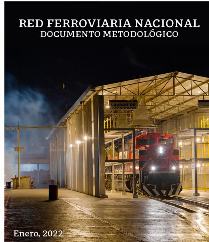
2. Documento Metodológico