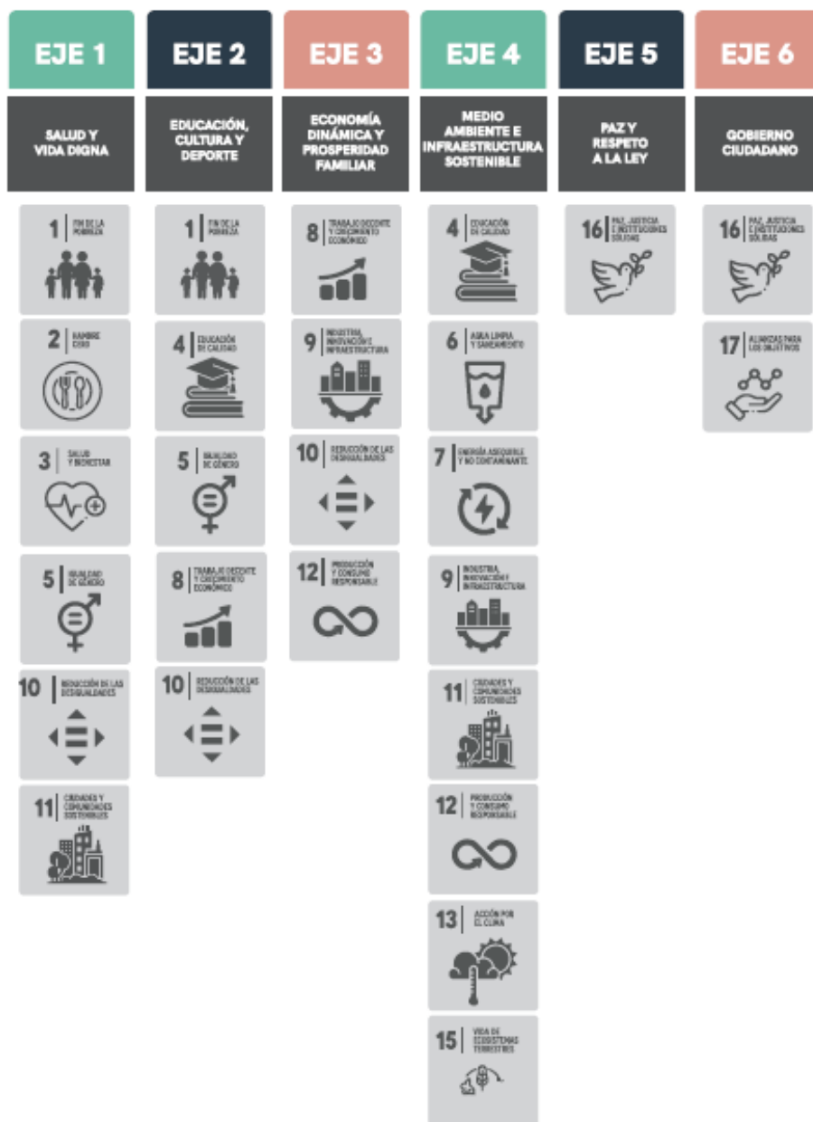
Figura 3. Alineación PED y ODS.