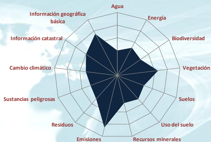
Información generada 2012